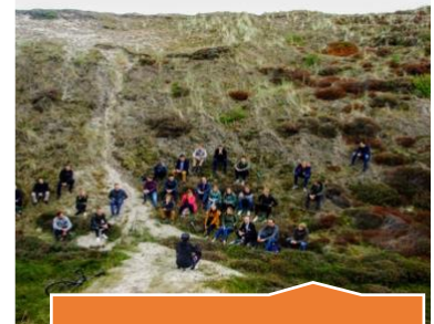
Groot bereik met minimale impact