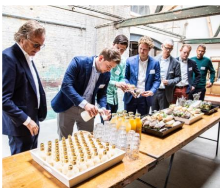
Inkoop & Keten

Groot bereik met minimale impact op het milieu