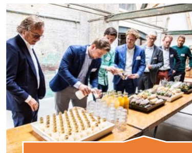
Gezond, lokaal en circulair

Gezond en circulair inkopen en gebruikmaken van de lokale markt, dat zijn onze kernwaarden voor het thema Inkoop en Keten.