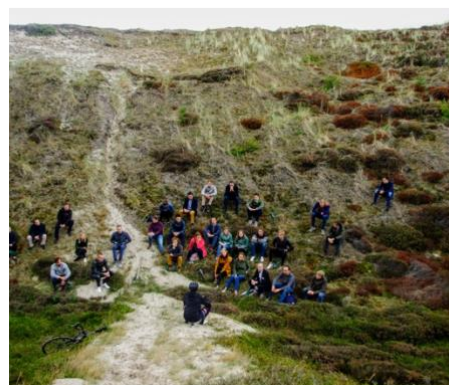
Events & Trainingen

Prettige werkplek met minimaal verbruik van bronnen