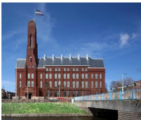
Huisvesting & ICT

Prettige werkplek met minimaal verbruik van bronnen