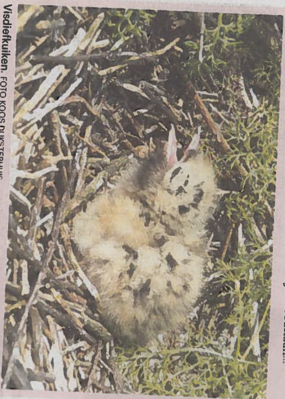
Visdiefkuiken. FOTO KOOS DIJKSTERHUIS