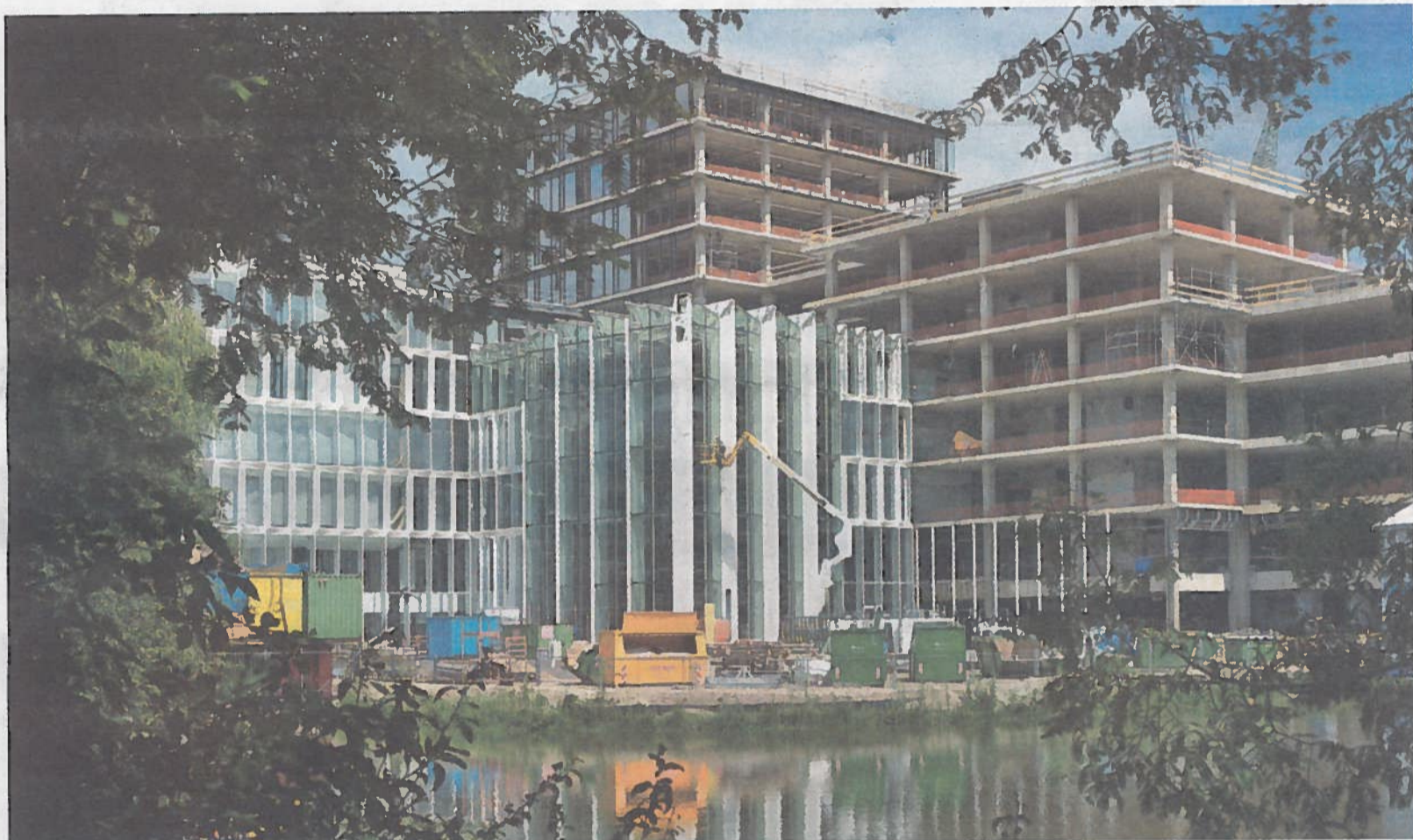
Leegstaand vastgoed heeft betere kansen bij herbesteding nadat het energiezuinig is gemaakt. Op de foto het Amex-complex in Utrecht dat is gestript en vervolgens opnieuw opgebouwd. Vermindering van het energieverbruik speelt daarbij een hoofdrol.