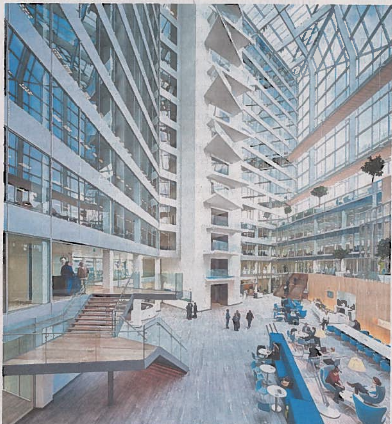
Het atrium van The Edge.

lijkt hier een duidelijke invloed op te hebben.”