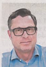
Van Eekhoven.